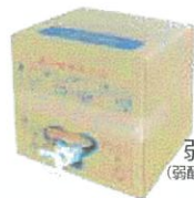
弱酸性除菌水 (弱酸性次亜塩素酸水溶液)