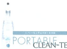
スプレー型次亜塩素酸水生成器 PORTABLE CLEAN-TE