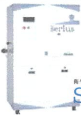
衛生マネージャー セリウス serius