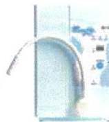
ハイクロソフト水生成装置 WELL CLEAN-TE Plus