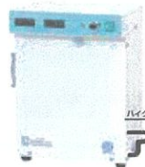
ハイクロソフト水生成装置 アワチッド 70