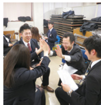
「致知」をテキストにした勉強会で人間力を高める

都機工は現在、生産設備の構築や工場のリフォームなどを請け負う産業設備事業に力を入れている。